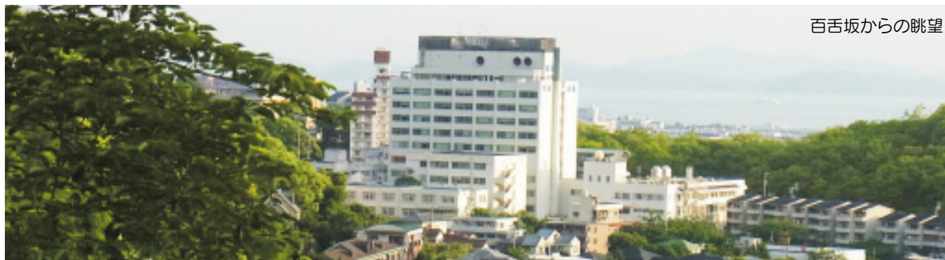
百舌坂からの眺望