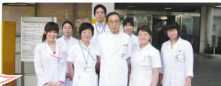
地域医療連携室メンバー

地域医療連携室の職員が4月1日から変わりました。不慣れな事で、ご迷惑をおかけ致しておりますが、前任者同様これからもよろしくお願いいたします。