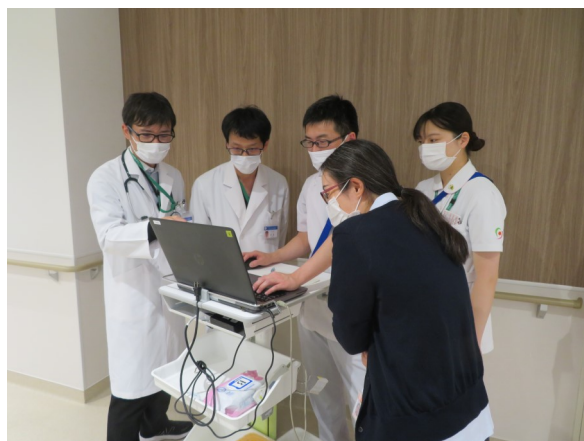
糖尿病チーム ラウンド