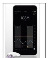
ガーディアン コネクト