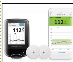
フリースタイルリブレ