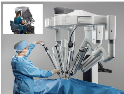
手術支援ロボット da Vinci Xi® サージカルシステム

また開腹手術と比べて傷口を小さくできるため、体への負担が少なく、より早い回復を見込むことができるほか、合併症を最小限に抑えられることもロボット手術の大きなメリットです。手術時間も従来の手術とあまり変わらず、健康保険も適応されるので医療費の負担もほぼ変わりません。