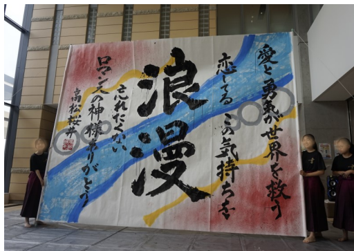
高松桜井高校書道部による書道パフォーマンス（みんなの病院文化祭にて）